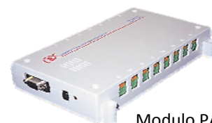
Modulo PA-16 PageAlert